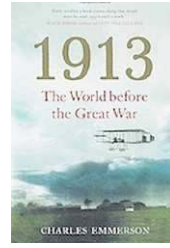
Charles Emmerson: 1913. The World before the Great War. The Bodley Head, 528 blz. € 29,-

Vaak worden de jaren voor 1914 beschreven als een opmaat naar WO I. Maar dat waren ze volgens historicus Charles Emmerson niet. 1913 was eerder een jaar vol mogelijkheden.