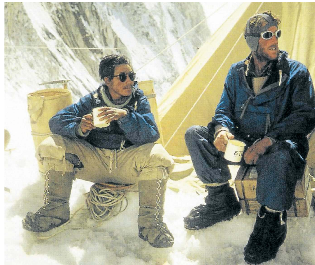
Norgay Tenzing (links) en Edmund Hillary, op 30 mei 1953, één dag na hun beklimming van de Mount Everest, in kamp IV.