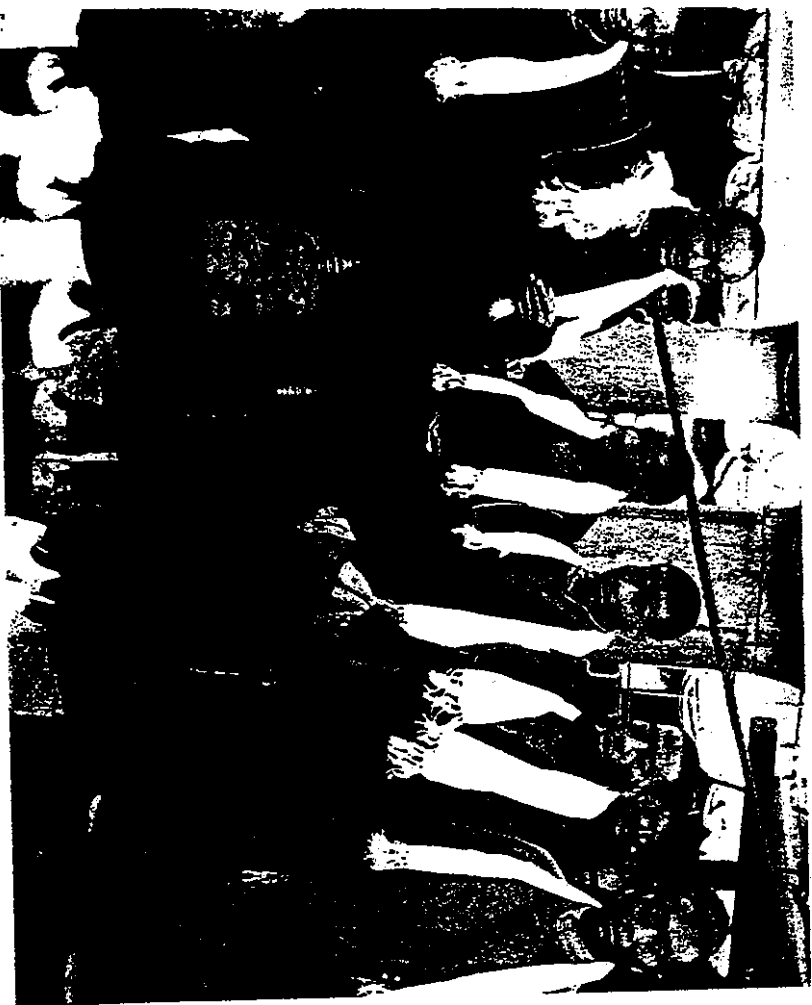
Abb. 1 Die tanzenden Lamas vom Everest. Diese Szene aus einer britischen Nachtichtensendung zeigt die tanzenden Lamas in London. Sie traten auf britischen und deutschen Bühnen vor Vorführungen des Films The Epic of Everest (1924) auf.

brachte seine Filmgesellschaft ohne Erlaubnis der tibetischen Regierung eine Gruppe tibetischer Mönche aus Gyantse nach London, die dort im Jahre 1924 vor der Vorführung von The Epic of Everest auf der Bühne auftraten (siehe Abb. 1). Ihr Auftreten, wie auch einige Szenen aus dem Film, verstimmten die tibetische Regierung derart, daß sie ihre Erlaubnis für weitere Everest-Expeditionen zurückzog. Da ich anderweitig bereits darüber geschrieben habe, möchte ich hier nur eine kurze Zusammenfassung dieser Ereignisse geben, um die Bedeutung der tibetischen Ansichten über das Kino in den 20er Jahren darzulegen. Angesichts der militärischen Bedrohung durch China in den frühen 20er Jahren hatte Tibet im Austausch gegen britische Waffenlieferungen die Erlaubnis zu Everest-Expeditionen erteilt. Nach den Aufführungen dieser »tanzenden Lamas« wiederrief die tibetische Regierung diese Erlaubnis, bis in den 30er Jahren die Bedrohung durch China wieder stärker wurde. Darüberhinaus veränderte die Affäre um die »tanzenden Lamas« in der Mitte der 20er Jahre die Machtverhältnisse zwischen Militär und Klöstern zugunsten der letzteren und beeinflusste die britischen wie die tibetischen Ansichten über künftige Tibetfilme.